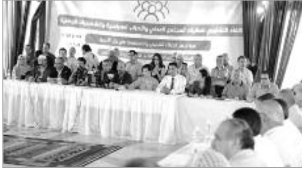
■ سارة ط.

أجمع المشاركون في اللقاء التشاوري لفعاليات المجتمع المدني والأحزاب السياسية والشخصيات الوطنية، الذي انعقد أمس بقصر المعارض الصنوبر البحري بالعاصمة، على أهمية الحوار كسبيل وحيد للخروج من الأزمة السياسية الحالية عن طريق تنظيم انتخابات رئاسية تخدم المصلحة العامة للبلاد، فيما تباينت مواقف الأحزاب السياسية من لجنة الحوار والوساطة.