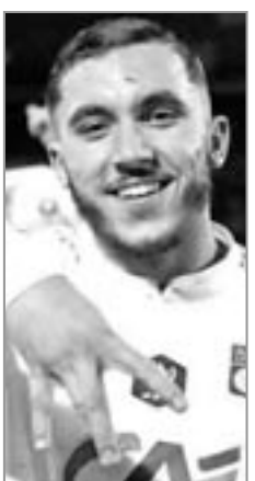
حيث قدم النادي الألماني مبلغ 15 مليون أورو من أجل ضم اللاعب في سوق

التحويلات الصيفية الجارية حالية، وهي قيمة جيدة كون عقد اللاعب ينتهي في شهر جوان 2025، ما يجعل إدارة نادي ليون تعمل على بيع عقده حاليا أو تمديد عقده لتفادي رحيله مجاناً الصيف المقبل. وكان نادي ليون قد قدم عرضاً لمدة 4 سنوات للاحتفاظ بريان شرقي إلا أن المهمة لن تكون سهلة، في ظل تواجد عددا من الأندية التي تسعى للتعاقد معه في صورة ليفربول وتوتنهام والباريس ودورتوموند وباريس سان جيرمان الفرنسي. إيسري.م.ب