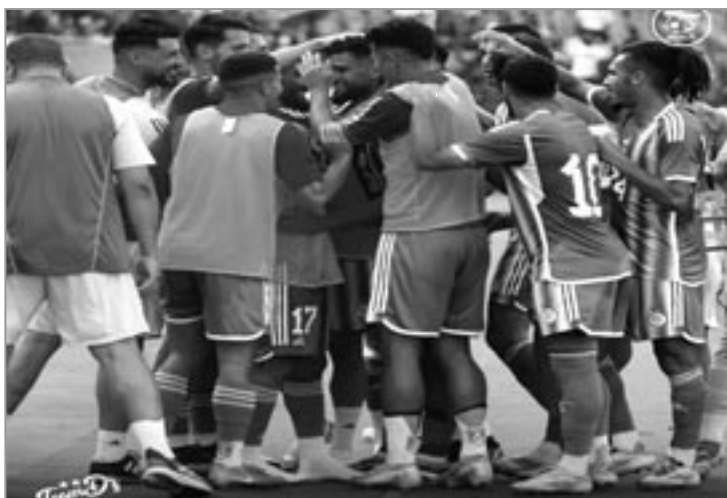
إيسري م. ب

تمكن المنتخب الوطني الجزائري من تخطي اختبارات تربص شهر سبتمبر الذي تخللته مواجهتين أمام كل من غينيا الاستوائية وليبيريا في تصفيات كأس إفريقيا المغرب 2025.