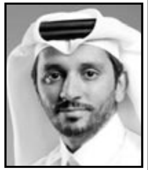
■ فهد عبد الرحمن بن عبد العزيز آل سعود عن الشرق القطرية

هذه المنتجات بشكل كبير. وعلى صعيد سياسة أسعار الفائدة، لم تحدث تحولات كبيرة في التوجهات السياسية تغيرات كبيرة. فقبل أكثر من عام بقليل، أي في أواخر عام 2023، كان بعض خبراء الاقتصاد يتوقعون حدوث عدة تخفيضات لأسعار الفائدة خلال عام 2024. ولكن الركود لم يشكل تهديداً، وأثبتت التوقعات الأكثر جديداً لصندوق النقد الدولي والبنوك المركزية أنها أقرب إلى الصواب، حيث توقعوا حدوث ثلاثة تخفيضات فقط لأسعار الفائدة خلال عام 2024. وفي النهاية، حدث تخفيضان فقط، وإن كان أحدهما بنسبة نصف في المائة، وليس ربع في المائة كما هو معتاد، لذا فإن هذا التوقع، الذي أشعر بالارتياح لأن أقول أنني كنت قد وافقت عليه قبل عام، كان في محله. واستمر ارتفاع معدلات التوظيف في الولايات المتحدة خلال عامي 2023 و2024. ففي الفترة من أكتوبر 2023 إلى أكتوبر 2024، أتاحت 194 ألف وظيفة إضافية كل شهر في المتوسط، وفقاً للبيانات الصادرة عن مكتب إحصاءات العمل. وارتفع معدل البطالة في منتصف العام الحالي إلى 4.3٪ قبل أن يتراجع إلى 4.1٪. وكان نمو الناتج المحلي الإجمالي في الولايات المتحدة في نطاق يتراوح من 2-3٪ سنوياً على مدار السنوات القليلة الماضية، باستثناء