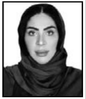
■ د. فهد بن عبد العزيز آل سعود عن الشرق القطرية

هذه المنتجات بشكل كبير. وعلى صعيد سياسة أسعار الفائدة، لم تحدث تحولات كبيرة في التوجهات السياسية تغيرات كبيرة. فقبل أكثر من عام بقليل، أي في أواخر عام 2023، كان بعض خبراء الاقتصاد يتوقعون حدوث عدة تخفيضات لأسعار الفائدة خلال عام 2024. ولكن الركود لم يشكل تهديداً، وأثبتت التوقعات الأكثر جديداً لصندوق النقد الدولي والبنوك المركزية أنها أقرب إلى الصواب، حيث توقعوا حدوث ثلاثة تخفيضات فقط لأسعار الفائدة خلال عام 2024. وفي النهاية، حدث تخفيضان فقط، وإن كان أحدهما بنسبة نصف في المائة، وليس ربع في المائة كما هو معتاد، لذا فإن هذا التوقع، الذي أشعر بالارتياح لأن أقول أنني كنت قد وافقت عليه قبل عام، كان في محله. واستمر ارتفاع معدلات التوظيف في الولايات المتحدة خلال عامي 2023 و2024. ففي الفترة من أكتوبر 2023 إلى أكتوبر 2024، أتاحت 194 ألف وظيفة إضافية كل شهر في المتوسط، وفقاً للبيانات الصادرة عن مكتب إحصاءات العمل. وارتفع معدل البطالة في منتصف العام الحالي إلى 4.3٪ قبل أن يتراجع إلى 4.1٪. وكان نمو الناتج المحلي الإجمالي في الولايات المتحدة في نطاق يتراوح من 2-3٪ سنوياً على مدار السنوات القليلة الماضية، باستثناء