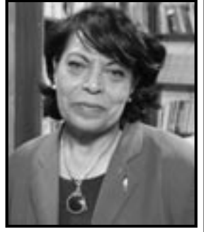
■ بقلم: أسماء ناصر أبو عياش