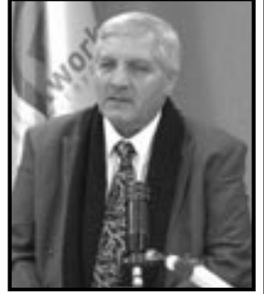
■ بقلم: المتوكل هله

ونقول هذا الكلام كله، من أجل أن نقول إن خطابنا الرسمي الذي يتعاش ويتكيف مع الهزيمة، يستبعد كلياً خيار تحرير القدس، أليس هذا غريباً؟ أليس عدم الكلام عن التحرير تعاشياً مع الهزيمة وتكيفاً معها وقبولاً لها؟! عندما نتحدث بلغة لا نؤمن بها ولا نصدقها، تتحول هذه اللغة إلى خطوط مرنة ولكنها غليظة وطويلة، حتى تكفي لتأليف حكايات ينقصها الصدق والصراحة والجرأة، وعندما لا نتحدث عن تحرير القدس التي تؤلف جوهر