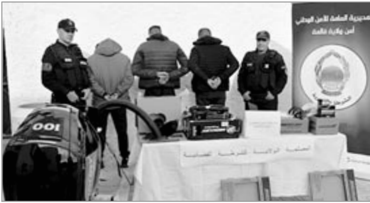
أحكام متفاوتة عن تهم تكوين جمعية أشرار لغرض الإعداد لجناية إلى جانب جناية تهريب المهاجرين عن طريق جماعة المنصرم من حل قضيتين تتعلقان بجرم السرقة.

تمكنت فرقة مكافحة تهريب المهاجرين والإتجار بالبشر التابعة للمصلحة الولائية للشرطة القضائية بأمن ولاية قالة من إحباط عملية هجرة غير شرعية عبر البحر وتوقيف 03 أشخاص مشتبه فيهم تتراوح أعمارهم بين 27 و28 سنة ينحدرون من مدينة قالة.