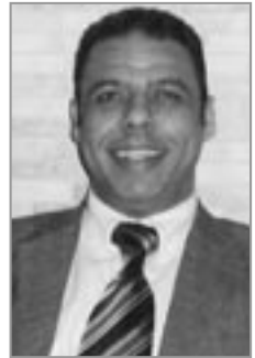
■ الدكتور حسن العاصي أكاديمي وباحث في الأنثروبولوجيا