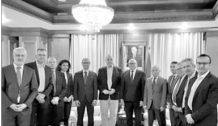
■ وسيم. ك

استقبل كاتب الدولة لدى وزير الطاقة، المكلف بالطاقات المتجددة، نور الدين ياسع، أمس، وفدا من شركة "بوش" الألمانية. وحسب بيان للوزارة، يهدف هذا اللقاء إلى تعزيز الشراكة الثنائية بين الجزائر وألمانيا في مجال الطاقات الجديدة والمتجددة والهيدروجين الأخضر وتبادل الخبرات لدعم التحول الطاقوي المستدام في الجزائر.