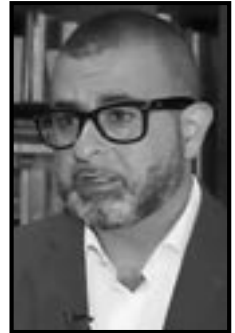
■ بقلم: دميتري دلياني / فلسطين - القدس المحتلة

أكد دميتري دلياني، عضو المجلس الثوري والمحدث باسم تيار الإصلاح الديمقراطي في حركة فتح، أن "قرار رئيس وزراء حكومة الاحتلال بنيامين نتنياهو بتعليق عملية تبادل الأسرى إلى أجل غير مسمى يُعد تجسيدا منهجيا لكسر الاتفاقيات بدوافع سياسية وإيديولوجية، مما يكشف بلا غموض أن الهدف الأسمى لدولة الاحتلال يتمثل في فرض السيطرة الاستعمارية المطلقة على شعبنا، متجاوزة كافة الاعتبارات، حتى تلك التي تضمنها الاتفاقيات الدولية." وأشار دلياني إلى أن دولة الاحتلال تختلق ذرائع لإيقاف تنفيذ اتفاق وقف حرب الإبادة في غزة؛ وإن قرار نتيها هو اتى رضوخا لإملاءات شريكه الرئيسي في الائتلاف الحكومي بتسليم سموتريتي، الذي يتبنى موقفاً علنياً بعدم الخوض في المرحلة الثانية من عملية تبادل الأسرى، ويطالب باستئناف الحملة العسكرية الإبادية في قطاع غزة بهدف التطهير العرقي مقابل عدم الانسحاب من الاحتلال. وأشار القيادي الفتاوي إلى أن الشروط المتفق عليها كانت تقتضي إطلاق سراح 602 أسير فلسطيني يوم امس، منهم 445 اختطفوا من غزة منذ اندلاع حرب الإبادة في عام 2023، بالإضافة إلى 157 آخرين كان من المقرر تحريرهم، بينهم 50 يُحكم عليهم بالسجن المؤبد ضمن النظام القضائي العسكري الظالم لدولة الاحتلال.